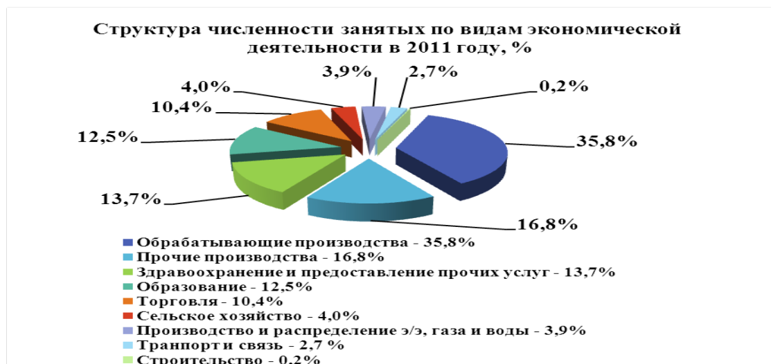
Диаграмма распределения занятых по отраслям экономики за 2011 год по Сосновскому району.