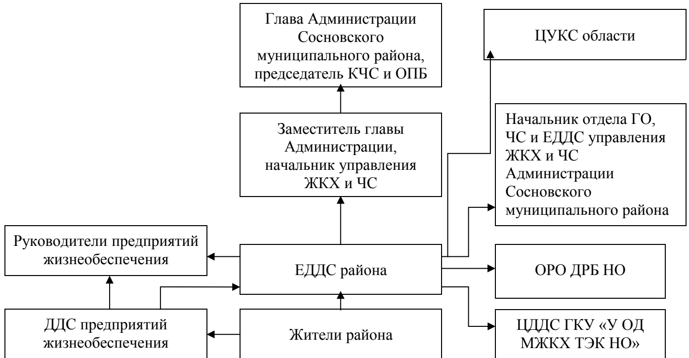
Схема оповещения ответственных лиц при авариях и ограничениях на объектах жизнеобеспечения Сосновского муниципального района Нижегородской области

Утвержден постановлением Администрации Сосновского муниципального района Нижегородской области от 15.11.2018 № 331