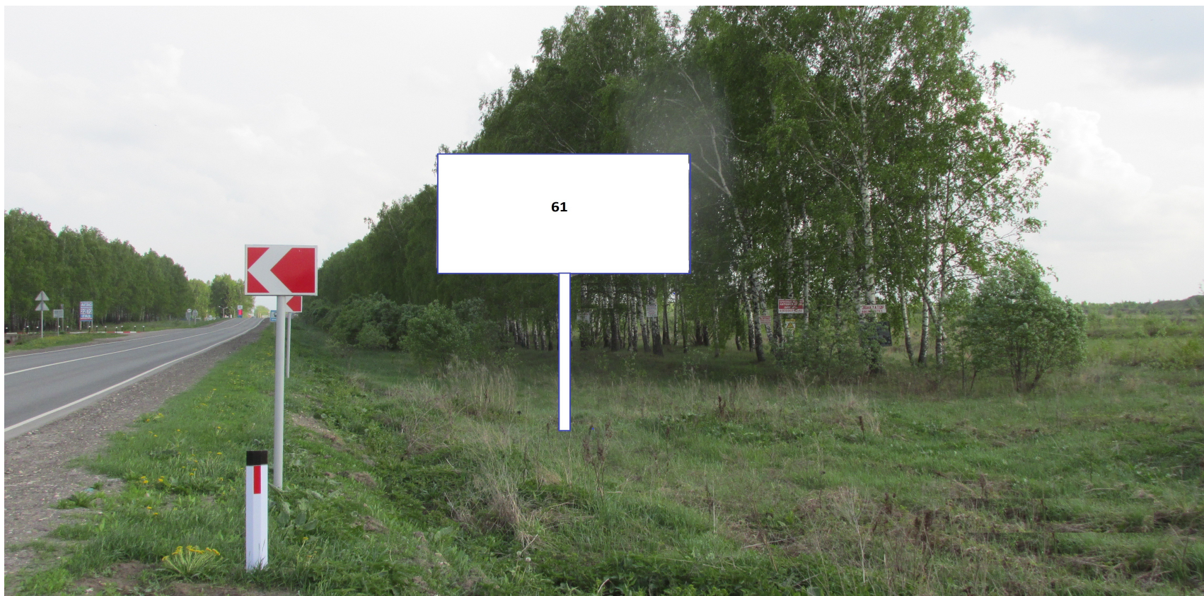
Схема рекламной конструкции среднего формата – двухсторонний рекламный щит 3х6м, состоящий из: фундамента (железобетон), каркаса (6,2х3,35м), опоры (4,5м), 2 информационных поля общей площадью 36 кв м (18 кв. м).