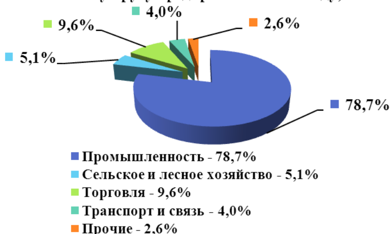
Структура экономики Сосновского муниципального района по полному кругу предприятий в 2011 году, %

Отгрузка товаров собственного производства за 2011 год по полному кругу организаций составила 1487,7 млн. руб. (по крупным и средним организациям - 1116,3 млн. руб.), удельный вес отгруженной продукции в общем объеме отгрузки по области – 0,12%.