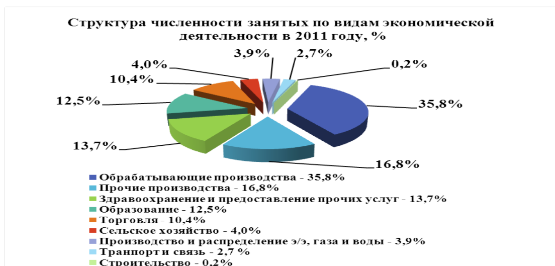
Диаграмма распределения занятых по отраслям экономики за 2011 год по Сосновскому району.

В 2011 году в экономике района было занято 7,23 тыс. чел. При этом основная доля занятых приходится на промышленность, в частности, на обрабатывающие производства - около 36% населения.